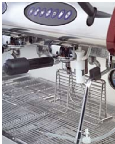
Automatic milk frother and fold-down tray for large, regular and espresso cups

Dieser Dampfauslauf dient zum MANUELLEN Schäumen und Erhitzen der Milch. Der Dampfauslauf wird vom Anwender manuell eingeschaltet, stoppt aber, sobald die eingestellte Temperatur erreicht ist.