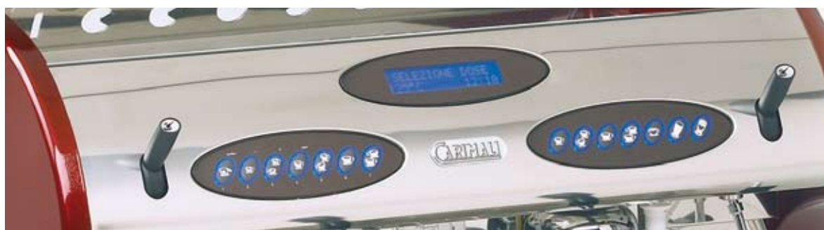
7 back-lighted key buttons and display for service info