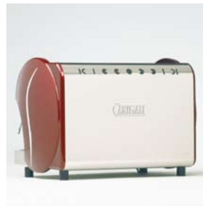
Rear panel in super mirror stainless steel